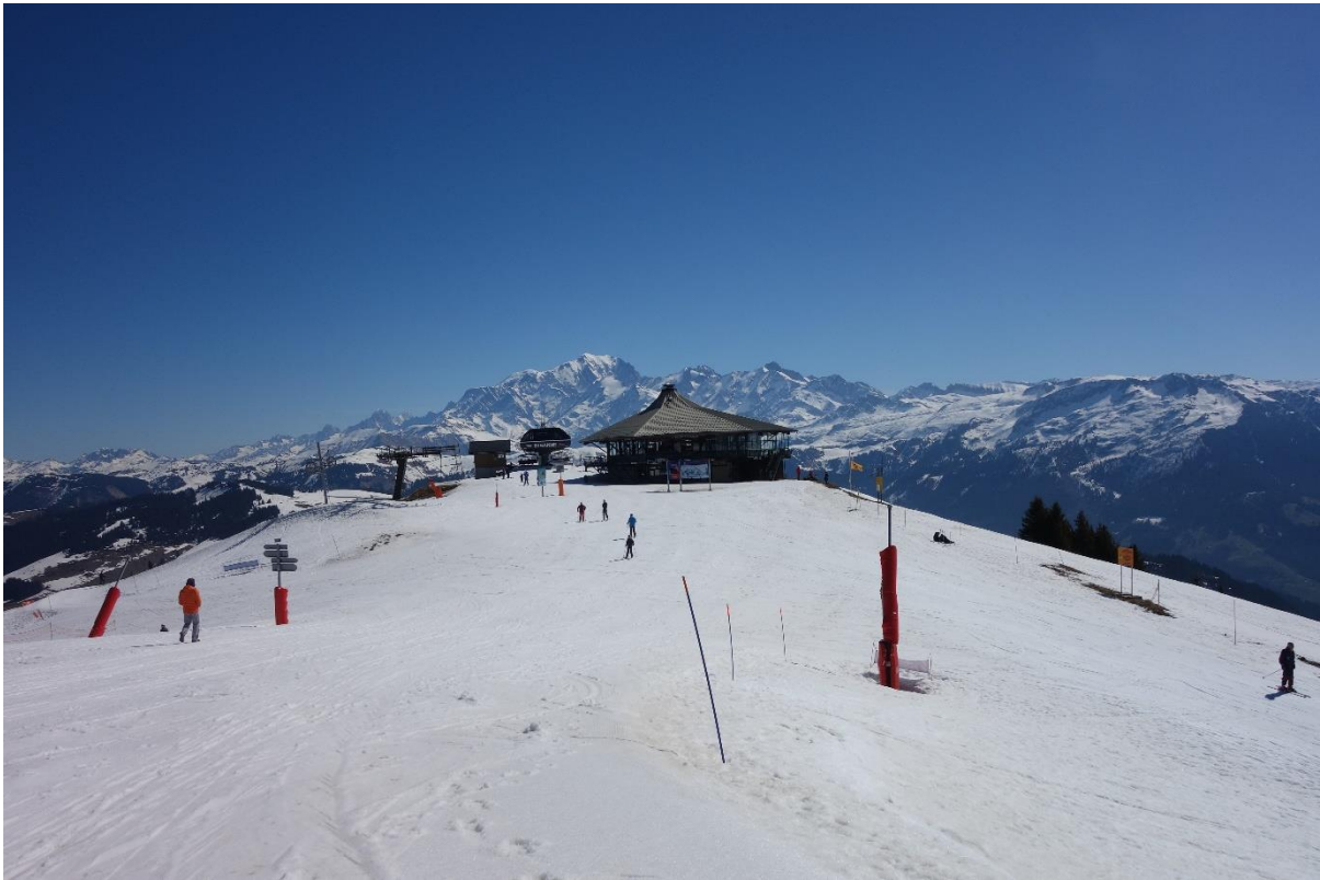
En face, le Mont Blanc et sur la droite, le deco.