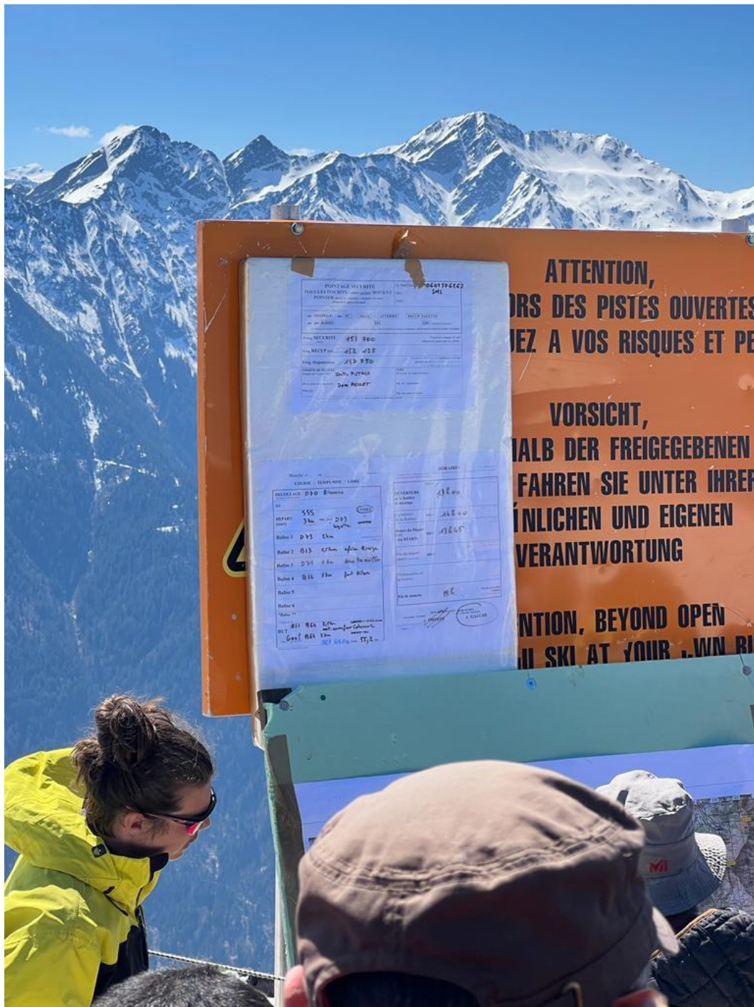
Tableau d'affichage de la première manche