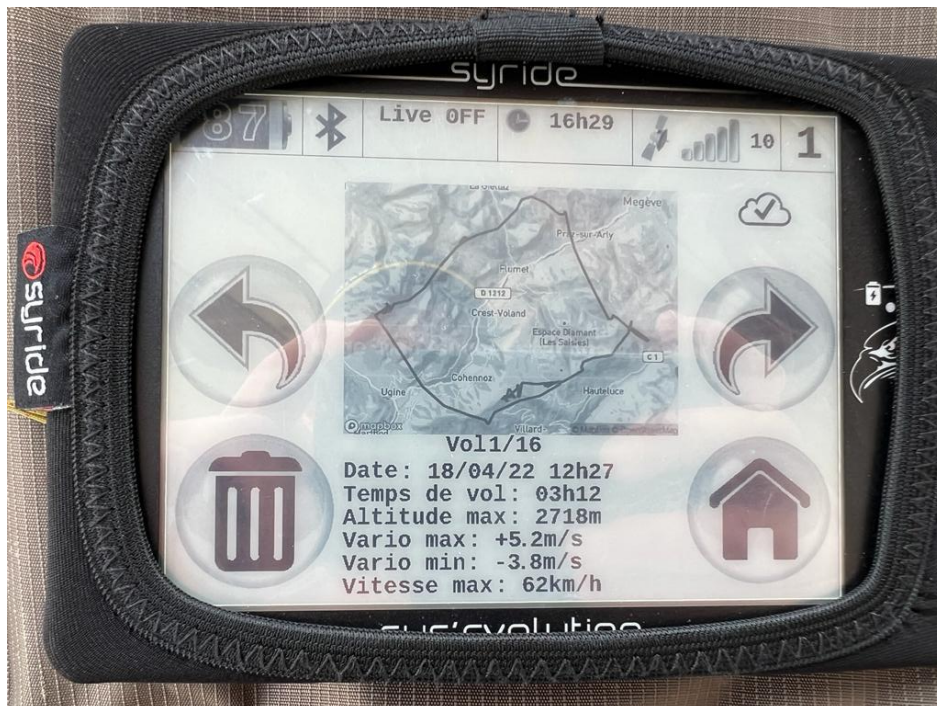
Instrument de Tanguy avec son vol Trace de la mache :

Vol de JEAN-BAPTISTE DUMANOIS du 18/04/2022