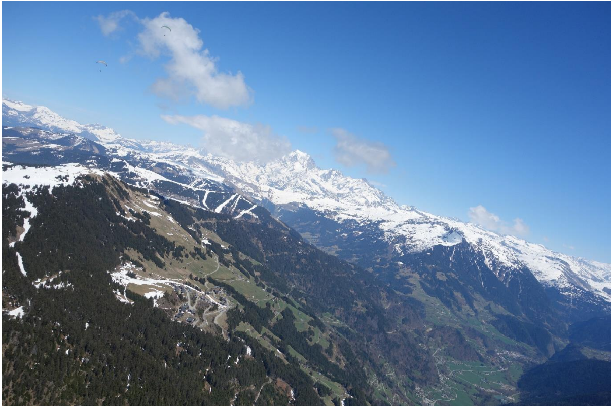
En laissant derrière lui les Saisies et le Mont Blanc au fond. JB (voile orange dans le coin en haut à gauche) à la poursuite de Vito ;o)