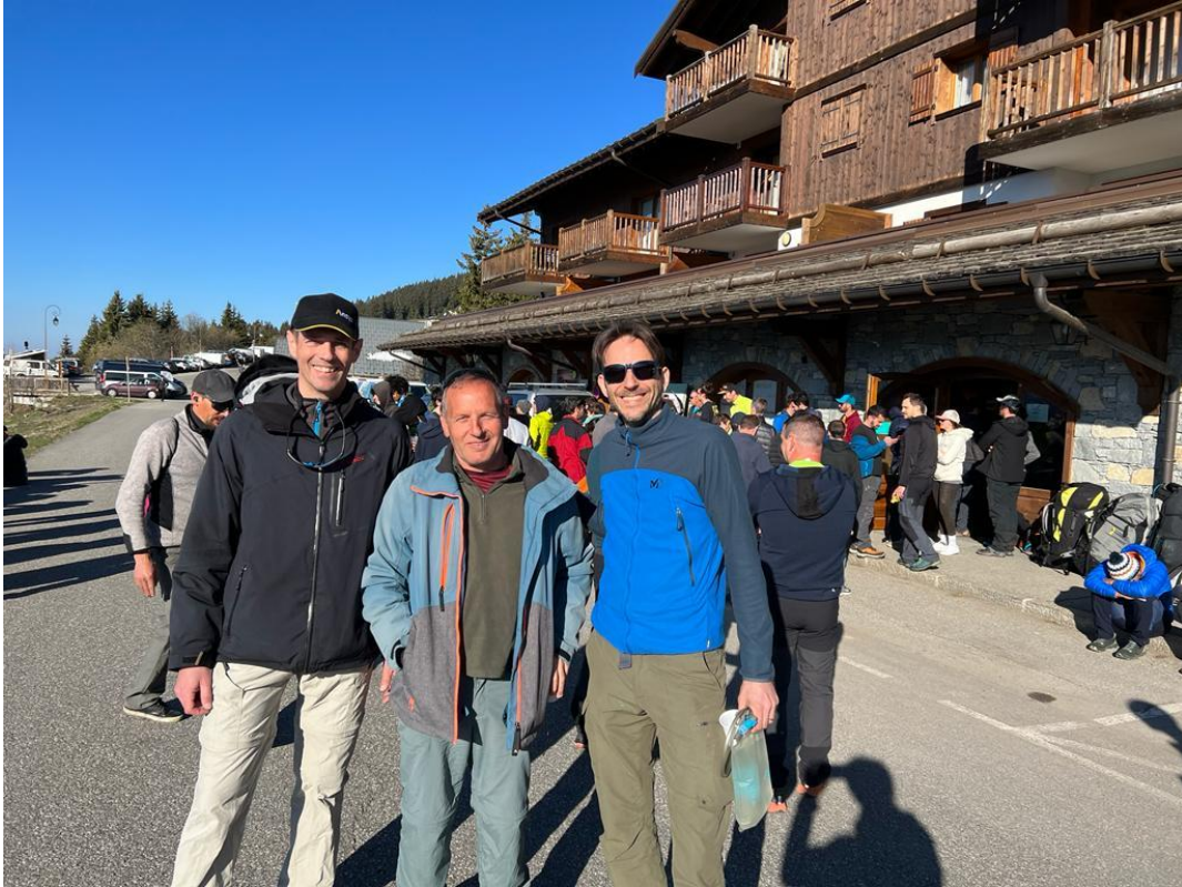
Arrivée au QG le dimanche matin