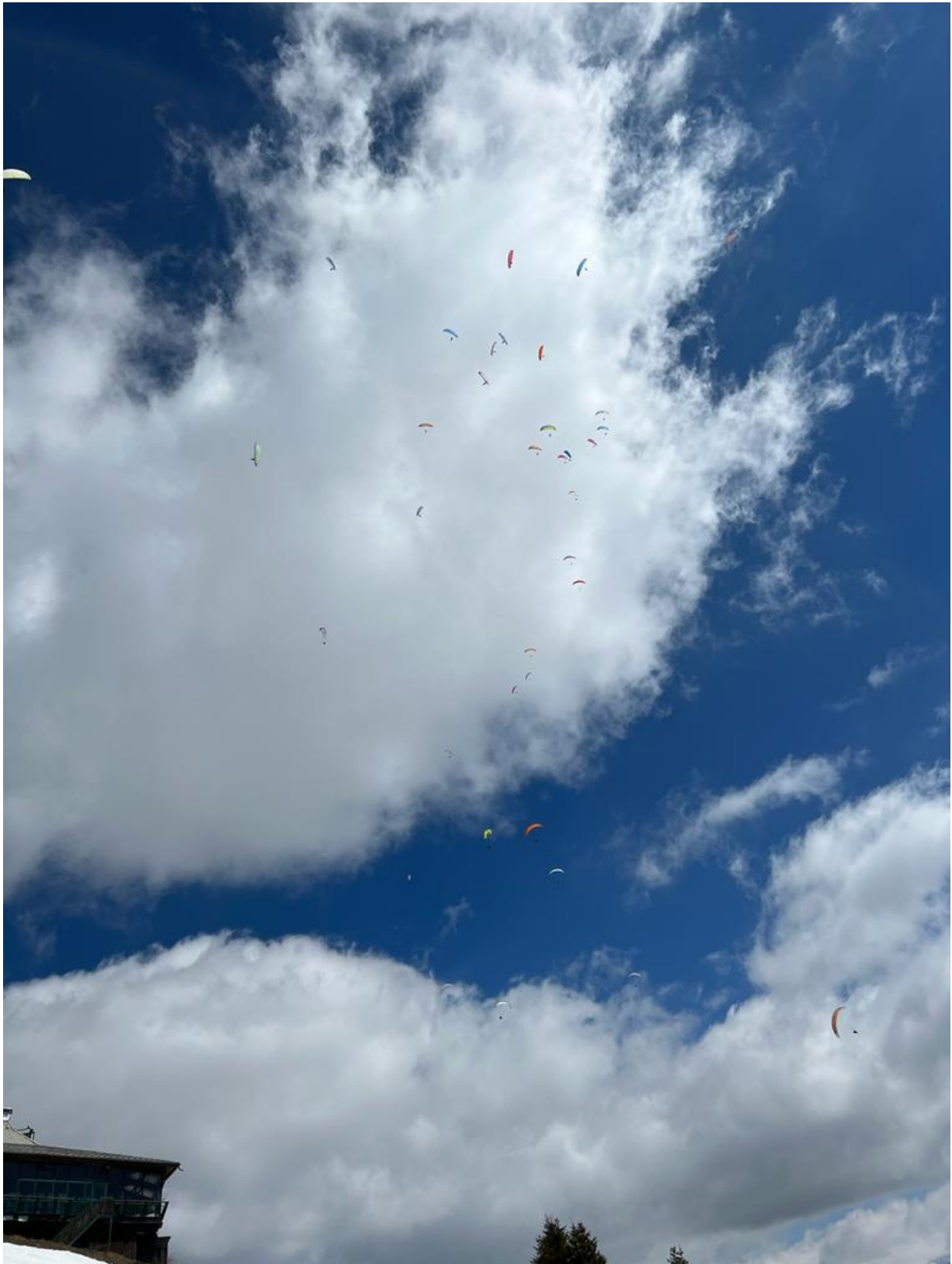
Ci-dessus : Premiers pilotes en l'air, la grappe se forme Ci-dessous : dans la grappe !